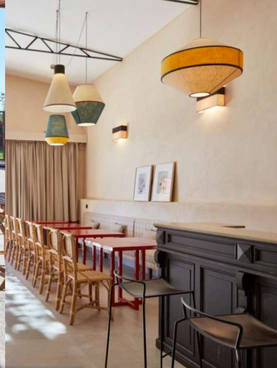
El salón principal